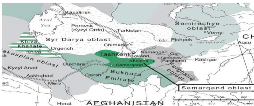
تقسیم‌بندی سیاسی عهد تزاری (Abazov, 2008: 94/m.33)

ب. نکته دوم این بود که مناطق بر جای مانده آسیای مرکزی، یعنی بخارا و خیوه با از دست دادن بسیاری از شهرها و ولایات مهم خود باج‌گزار و تحت‌الحمایه حکومت تزاری شده بودند. روسیه ضمن انتفاع از این شرایط، می‌توانست توجیهی برای آرام ساختن منتقدان نیز فراهم کند و آن استقلال ظاهری این مناطق بود (پیرمشایف، ۱۳۸۸: ۲۰۹). البته به نظر می‌رسد در صورت تداوم حضور روسیه تزاری در منطقه، تحقق تمرکز قدرت و الحاق این دو واحد سیاسی به فرمانداری کل، امر دور از ذهنی نبود. پشتوانه چنین ادعایی، ظهور تدریجی نشانه‌هایی است که همگام با ورود به قرن جدید، از تغییر سیاست روسیه در زمینه استقلال بخارا خبر می‌داد. بی‌شک یکی از مهم‌ترین عوامل در این تغییر مشی، کم‌رنگ شدن «بازی بازگ» ۱ به عنوان مهم‌ترین عامل محرک خارجی بود. منافع مستقیم اقتصادی که روس‌ها از تصرف امارت می‌توانستند داشته باشند، به تدریج در طول این سالها عیان شد؛ به همین دلیل در محافل رسمی روسیه بحث‌هایی درباره انحلال امارت در گرفت. توجیه مقامات روس این بود که در امارت وضع بسیار نامطلوبی حاکم است که برای رهایی از آن ناگزیر باید به جای نظام اداری محلی، ترتیبات روسیه را جاری کرد و امیر فقط به عنوان نماینده منصوب شود (غفوروف، همان، ۱۰۹۹). در سال ۱۹۱۵م/۱۳۳۳ق. دولت روسیه عملاً تصمیم به انحلال خانات خیوه و بخارا و