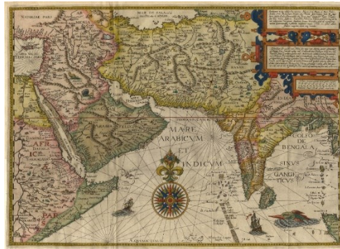
نقشه شماره ۵. پرشیا

Henricus (Hendricus) Florentinus van Langren (1574-1648)