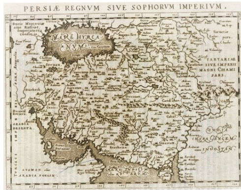
نقشه شماره ۶. پادشاهی پرشیا یا امپراتوری صفوی ۱۰

پرشیا منطبق با ایران، در میان عربیبا در باختر و سند و هند در خاور قرار دارد. البته مهم‌ترین بخش این نقشه از دیدگاه نام و مفهوم ایران، ثبت واژه پرشیا در کنار نام ایالت فارس ۱ است. تردیدی وجود ندارد که مقصود از واژه پرشیا نزد اروپاییان سده شانزدهم به بعد، گستره ایران امروز است نه ایالت فارس. در این نقشه قلمرو پرشیا از سرزمین‌های هم‌جوار هند و آرابیا با رنگی دیگر متمایز شده است. در نقشه لانگرن قلمرو ایران از شرق به ارمنستان، ۲ دیاربکر ۳ و بین‌النهرین، ۴ کلمده قدیم ۵ و بیابان عرب ۶ و از شمال به دریای نمک (یا کاسپی) و بخارا ۷ محدود است. گستره شرقی پرشیا در این نقشه مشخص نیست، اما در جنوب شرقی آن هند ۸ دیده می‌شود. جنوب نیز به دریای بزرگ پارس و یا اقیانوس هند ۹ محدود است.