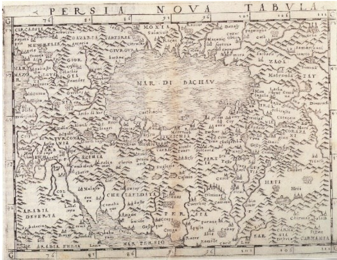
نقشه شماره ۲. نقشه جدید پرشیا [ایران] ۱

Giacomo Gastaldi (1500- 1565), Venice: 1548, 12/5× 17 cm (Al- Qasimi, 1999: 22)