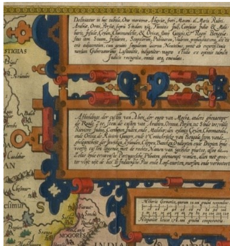
کارتوش نقشه لانگرن

«هنریش هوندیوس» گراوریست و نقشه کش آلمانی، گستره وسیعی میان دره رود نیل تا سواحل برمه را نمایش داده است. نقشه به زبان آلمانی و دارای مقیاس ۵۰ میلی متر به ۱۰۰ میلی یارد آلمانی است.