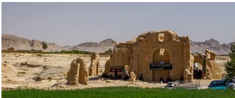
تصویر شماره ۱۴. محل صنوبر روستای دی‌هک (دی)

بزرگ وجود دارد. قسمت عمده مسیر آب از روستای فراغه (فروردین) تا روستای دی‌هک (دی) به صورت نهر بوده، اما این نهر در فاصله حدود ۸ کیلومتری روستا به شکل قنات درآمده و در نزدیکی روستا و در محلی که مسجد جامع کهن روستا قرار دارد، به سطح زمین می‌رسیده است. ۱ با توجه به اینکه مسجد جامع کهن روستای دی‌هک (دی) در مظهر قنات دی‌هک (دی) قرار دارد، احتمالاً محل درخت صنوبر روستای دی‌هک (دی) در محل این بنای تاریخی، معروف به «مسجد جامع کهن روستای دی‌هک (دی)» و در کنار سازه‌های آبی روستای شهریور است. ۲ نگارندگان با توجه به قدمت بنا معتقدند درخت صنوبر روستای دی‌هک (دی) در اواخر دوره ساسانی یا اوایل دوره اسلامی فرو افتاده و در جای آن به سبب تقدس و اهمیت آیینی آن، بنای مذکور ساخته شده است. به دلیل تقدس مکان این صنوبر، مانند محل روستای فروردین و شهریور، در روز عاشورا، دسته‌های عزاداری به این محل می‌آیند و مراسم عزاداری را برگزار می‌کنند.