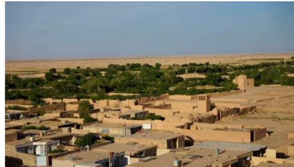
تصویر شماره ۱۵. نمای از روستای تاریخی مهرآباد (مهر) و محله کشمیر (کاجمر)