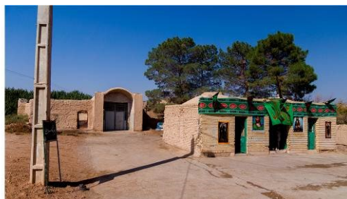
تصویر شماره ۱. زیارتگاه سرو علی در روستای فروردین (فراغه)، محل صنوبر شاهدرخت

خاتون آبادی درباره روستای آبان اصحاب رس معتقد است این روستا در کنار شهر ابرقو قرار دارد. در زمان بازدید او، این روستا با نام ظهر طاحونه و یا پشت آسیاب خوانده می‌شد که سرو معروف ابرقوه در آن محل قرار دارد. او این سرو را هم خانواده سرو فروردین، سرو علی در روستای فراغه که شاهدرخت بود، دانسته و عمر این درخت را به نقل از سیاحان پنج‌هزار سال نوشته است (خاتون آبادی، ۱۳۱۳: ۶۹؛ همو، ۱۳۱۶: ۱۴-۱۷). درباره این سرو مطالب بسیاری در کتاب‌های مختلف معاصر نوشته شده است؛ از جمله ایرج افشار در کتاب یادگارهای یزد درباره این سرو چنین نوشته است: «سرو پشت آسیاب: سرو مشهور ابرقو که از کهن‌ترین و زیباترین سروهای باستانی ایران است. در محله پشت آسیاب گل‌کاران بیننده مشتاق را محو جمال خود می‌سازد. این سرو از حیث شاخه شاخه بودن بسیار دیدنی و خوش‌ترکیب است» (افشار، ۱۳۷۴: ۱/۳۵۶). نگارندگان برای بررسی و تهیه گزارش به این منطقه مراجعه کرده‌اند که نتایج آن بدین شرح است: سرو ابرقو در طول جغرافیایی ۵۳۱۶.۴۷ و عرض جغرافیایی ۳۱/۰۷.۲۱ و ارتفاع ۱.۵۱ کیلومتر از سطح دریا در سمت جنوب شرقی شهر قرار دارد. ۱ این سرو از نهری که از روستای فراغه