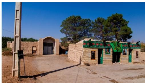
تصویر شماره ۱. زیارتگاه سرو علی در روستای فروردین (فراغه)، محل صنوبر شاهدرخت