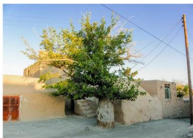
تصویر شماره ۱۱. نمای از مسجد دوازده‌امام روستای تیر (تیزک)، محل درخت صنوبر روستای تیر