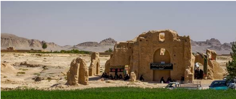
تصویر شماره ۱۴. محل صنوبر روستای دی‌هک (دی)

بزرگ وجود دارد. قسمت عمده مسیر آب از روستای فراغه (فروردین) تا روستای دی‌هک (دی) به صورت نهر بوده، اما این نهر در فاصله حدود ۸ کیلومتری روستا به شکل قنات درآمده و در نزدیکی روستا و در محلی که مسجد جامع کهن روستا قرار دارد، به سطح زمین می‌رسیده است. ۱ با توجه به اینکه مسجد جامع کهن روستای دی‌هک (دی) در مظهر قنات دی‌هک (دی) قرار دارد، احتمالاً محل درخت صنوبر روستای دی‌هک (دی) در محل این بنای تاریخی، معروف به «مسجد جامع کهن روستای دی‌هک (دی)» و در کنار سازه‌های آبی روستای شهریور است. ۲ نگارندگان با توجه به قدمت بنا معتقدند درخت صنوبر روستای دی‌هک (دی) در اواخر دوره ساسانی یا اوایل دوره اسلامی فرو افتاده و در جای آن به سبب تقدس و اهمیت آیینی آن، بنای مذکور ساخته شده است. به دلیل تقدس مکان این صنوبر، مانند محل روستای فروردین و شهریور، در روز عاشورا، دسته‌های عزاداری به این محل می‌آیند و مراسم عزاداری را برگزار می‌کنند.