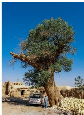
تصویر شماره ۶. درخت صنوبر روستای خرداد تصویر شماره ۷. تصویر سرو آذر (سرو صحافیها)