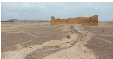
تصویر شماره ۱۳. نمایی از نهر شهرآباد (شهریور) و آسیاب آبی آن

ساسانی بوده و همچنین با توجه به قرار گرفتن این چهارطاقی در مظهر قنات شهرآباد (شهریور) و در مرکز سازه آبی شبیه به معابد آب (آناهیتا)، معتقد است درخت صنوبر روستای شهرآباد (شهریور) در محل چهارطاقی مذکور و در میان سازه آبی قرار داشته و احتمالاً در دوره پیش از اسلام و در زمان ساسانیان فرو افتاده است و به سبب تقدسی که در میان مردمان این منطقه داشته، در جای آن آتشکده‌ای ساخته شده که بقایای آن تا به امروز باقی است. ۱