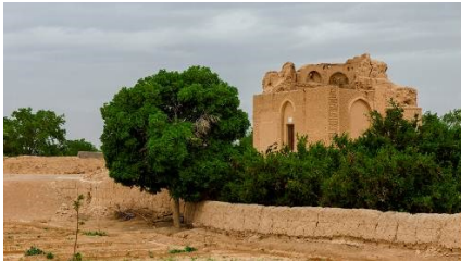
تصویر شماره ۱۶. مسجد جامع مهرآباد (محل صنوبر مهر)، محله کشمیر (کاجمر)

آشکده کهن مربوط به دوره ساسانی است. به نظر نگارندگان، انتساب نام مسجد جامع به این بنا در دوره اسلامی مانند مسجد جامع روستای دی‌هک (دی) به دلیل اهمیت آیینی و جنبه تقدس آن بوده است. این بنا مانند جایگاه دیگر روستاهای ذکرشده، در مظهر قنات مهرآباد (مهر) قرار گرفته است. بنابراین نگارندگان معتقدند محل احتمالی درخت صنوبر روستای مهرآباد (مهر) در محل این بنای تاریخی قرار داشته است. ۱ همچنین با توجه به قدمت بنا احتمال می‌رود که درخت صنوبر روستای مهر در دوره ساسانی فرو افتاده و در جای آن به سبب تقدس و اهمیت آیینی، آشکده‌ای ساخته‌اند. همچنین مرمت‌هایی در دوران اسلامی در این بنا صورت گرفته است که نشان می‌دهد بنای مذکور در دوره اسلامی نیز اهمیت ویژه‌ای داشته است. این بنا در محله تاریخی کشمیر روستای مهرآباد (مهر) قرار دارد. ۲ می‌توان کشمیر را تغییر یافته نام «کاشمر» دانست که واژه کاشمر خود برگرفته از واژه کاجمر به معنی کنار کاج است. ۳ وجود محله‌ای در کنار مسجد جامع کهن مهرآباد (مهر) که احتمالاً محل درخت صنوبر این روستا بوده، تأییدکننده محل صنوبر مهر و همچنین نشانگر نوع این صنوبر است و از روی این نام‌گذاری خردمندان می‌توان فهمید که صنوبر روستای مهر از نوع کاج بوده است.