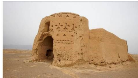
تصویر شماره ۸. نمایی از آسیاب نهر اردیبهشت (اردی) تصویر شماره ۹. نمایی از نهر اردیبهشت (اردی)

خاتون‌آبادی درباره روستای مرداد داستان اصحاب رس معتقد است: این روستا همان روستای مردادیه یا مردودیة ابرقوه است (خاتون‌آبادی، ۱۳۱۶: ۱۶). عبدالرحیم شریف نیز این روستا را با ماه مرداد انطباق داده و نوشته است: «مروئیه یا مدوئیه یا مردونیه: در جنوب ابرقو و در سه کیلومتری جنوب راه ابرقو به فخرآباد و سریزد» (شریف،