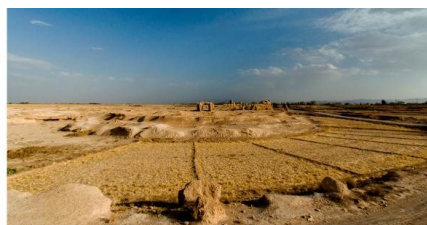
تصویر شماره ۱۴. محل سرو شهرآباد (شهریور) و سازه‌های آبی اطراف آن

خاتون‌آبادی درباره روستای دی معتقداند: این روستا همان روستای دیک در کنار روستای شهرآباد است (خاتون‌آبادی، ۱۳۱۶: ۱۷؛ همو، ۱۳۱۳: ۷۰). ۲ نگارندگان برای بررسی موقعیت و آثار روستای مذکور و همچنین پرسش از مطلعان محلی، به این منطقه مراجعه کرده‌اند که نتایج آن چنین است: دی‌هک یا دیک یا هیک یا هک، روستایی در دهستان مهرآباد از توابع بخش بهمن شهرستان ابرقوه در استان یزد ایران است. این روستا در کنار روستای شهرآباد (شهریور) در طول جغرافیایی ۵۳۱۸۰۷ و عرض جغرافیایی ۳۱۰۵۰۳ و در ارتفاع ۱۰۵۰ کیلومتر از سطح دریا و ۲۱۹ متر پایین‌تر از روستای فراغه (فروردین) قرار دارد. در سمت غرب این روستا و از سویی روستای فراغه (فروردین) و از سرچشمه روشاب بقایای یک نهر آب قدیمی و