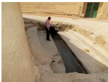
تصویر شماره ۲. چشمه روشاب در روستای فروردین (فراغه)