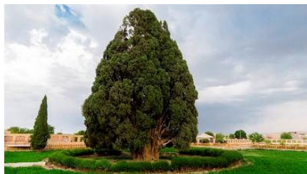
تصویر شماره ۴. نمایی از روستای تاریخی آبان