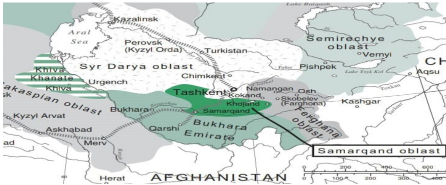
تقسیم‌بندی سیاسی عهد تزاری (Abazov, 2008: 94/m.33)

ب. نکته دوم این بود که مناطق بر جای مانده آسیای مرکزی، یعنی بخارا و خیوه با از دست دادن بسیاری از شهرها و ولایات مهم خود باج‌گزار و تحت‌الحمايه حکومت تزاری شده بودند. روسیه ضمن انتفاع از این شرایط، می‌توانست توجهی برای آرام ساختن منتقدان نیز فراهم کند و آن استقلال ظاهری این مناطق بود (پیرمشایف، ۱۳۸۸: ۲۰۹). البته به نظر می‌رسد در صورت تداوم حضور روسیه تزاری در منطقه، تحقق تمرکز قدرت و الحاق این دو واحد سیاسی به فرمانداری کل، امر دور از ذهنی نبود. پشتوانه چنین ادعایی، ظهور تدریجی نشانه‌هایی است که همگام با ورود به قرن جدید، از تغییر سیاست روسیه در زمینه استقلال بخارا خبر می‌داد. بی‌شک یکی از مهم‌ترین عوامل در این تغییر مشی، کم‌رنگ شدن «بازی بازگ» ۱ به عنوان مهم‌ترین عامل محرک خارجی بود. منافع مستقیم اقتصادی که روس‌ها از تصرف امارت می‌توانستند داشته باشند، به تدریج در طول این سالها عیان شد؛ به همین دلیل در محافل رسمی روسیه بحث‌هایی درباره انحلال امارت در گرفت. توجه مقامات روس این بود که در امارت وضع بسیار نامطلوبی حاکم است که برای رهایی از آن ناگزیر باید به جای نظام اداری محلی، ترتیبات روسیه را جاری کرد و امیر فقط به عنوان نماینده منصوب شود (غفوروف، همان، ۱۰۹۹). در سال ۱۹۱۵م/۱۳۳۳ق. دولت روسیه عملاً تصمیم به انحلال خانات خیوه و بخارا و