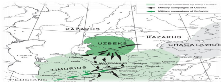
خاستگاه ازبکان (Abazov, 2008: 80)

نمودی از این موفقیت‌ها ورود ترکان مسلمان قراخانی در قالب اتحادیه قبیله‌ای به این سرزمین، شکل‌گیری رسمی حکومت‌های ترک و جاری شدن سنن سیاسی صحرانشینی بود. به‌طور قطع این تعدد قومیت‌ها و عدم وجود انسجام کافی میان آنها، علاوه بر ایجاد خرده‌فرهنگ‌ها، در تمرکزگریزی سیاسی نیز بسیار تأثیرگذار بود. ۱