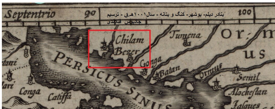
Arabia [F-1-1] (1/1)

همچنین نقشه «جادیوس هندیوس» ۱ فنلاندی (۱۵۶۳-۱۶۱۲م) که در حدود ۱۵۹۳م/۱۰۰۱ق. در آمستردام تهیه و چاپ اولیه آن در سال ۱۵۹۸م/۱۰۰۶ق. منتشر شده است. این نقشه دارای مکان نمایی بهتری است و بعد از هرموز، کنگ و بوشهر، ۲ در محل بندر دیلم واژه لاتین «chilam» را نوشته است. ۳ (در هر چهار نقشه مورد اشاره، به صراحت از بندر دیلم نام برده نشده است، ولی با ضبط نام چیلم/دیلم؛ از وجود بندری نوظهور، هر چند کوچک در ساحل خلیج فارس سر نخ می‌دهد).