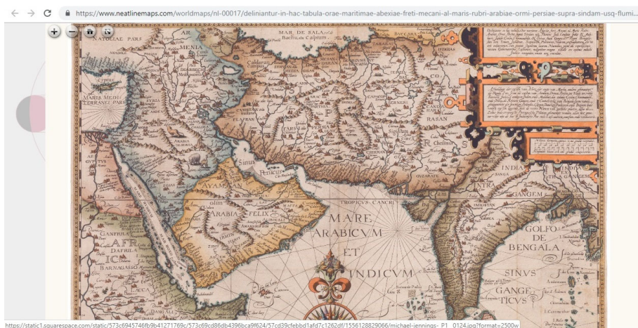
نقشهٔ ۱: ترسیم سال ۱۵۸۳/۹۹۱ق؛ بنادر بوشهر، ریشهر، دیلم و خلیج فارس (نمای کامل)

بندر دیلم با حروف لاتین «chilam» نخستین بار در نقشهٔ «گاسپار ویه‌گاس» پرتغالی ترسیم سال ۱۵۳۷/م ۹۴۳ق. دیده می‌شود (وثوقی و صفت‌گل، ۱۳۹۵: ۷۴۸/۳). سپس در سال ۱۵۴۵/م ۹۵۱ق. «ویه‌نا» نیز در نقشهٔ ترسیمی از «chillam» نام برده است (همان، ۷۵۳/۳). نقشهٔ زیر ترسیم ۱۵۸۳/۹۹۱ق. نیز به بنادر بوشهر، ریشهر و دیلم (chilam, bezer, reyxel) اشاره کرده که در مکان‌نمایی شهرهای ساحلی، نسبت به نقشهٔ بعدی دقت کمتری در آن دیده می‌شود. ۱