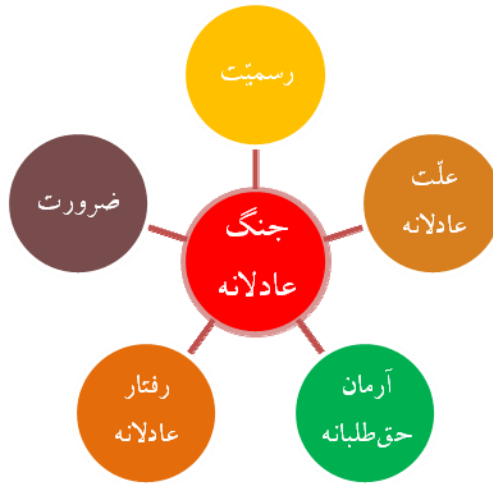
شکل ۲. شاخص‌های جنگ عادلانه

شاخص رسمیت به این مسئله می‌پردازد که مرجع مشروع اعلان جنگ، چه کسی یا چه نهادی است. در مسئله جنگ، جان و مال افراد جامعه در معرض خطر قرار می‌گیرد و بدین جهت تنها شخص یا نهادی، مشروعیت اعلان جنگ را دارد که با پشتوانه مردم به حکومت رسیده باشد. حاکم جامعه این صلاحیت را دارد که تحت شرایطی، این اختیار را به نماینده خویش واگذار کند از این‌رو نخبگان جامعه که متولی امر حکومت نیستند، بدون اذن حاکم چنین صلاحیتی ندارد.