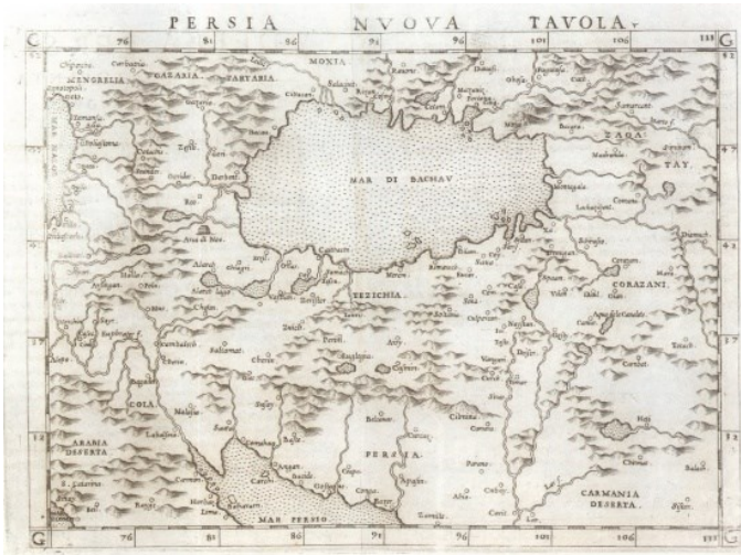
نقشه شماره ۳. نقشه جدید پرشیا [ایران] ۲

این نقشه با عنوان «نقشه جدید ایران» یکی از نخستین نمونه‌های چاپ نقشه جدید ایران در اروپا به شمار می‌رود (Alai, 2005: 37). چنان‌که به روشنی پیداست، منظور نقشه‌کش از پرشیا (ایران) منطبق با سرتاسر قلمرو صفویه و نه فقط ایالت تاریخی فارس است. انتخاب این عنوان پیروی سنتی بطلمیوسی بود که برای مناطق مختلف جهان از عنوان «Tabula» لاتین استفاده می‌کردند. البته استفاده از نام سرزمین ترسیم یافته، در نقشه‌های بطلمیوسی چندان رسم نبود، بلکه براساس نظام جغرافیانگاری بطلمیوس که آسیا به دوازده بخش تقسیم می‌شد، نقشه‌هایی که گستره ایران در آن قرار می‌گرفتند، بیشتر با عنوان «نقشه قسمت پنج آسیا» ۱ ترسیم می‌شد (برای آشنایی با نظام جغرافیایی بطلمیوس بنگرید به: انوری، ۱۳۹۶: ۱۸-۲۳؛ و برای نقشه‌های پنجم آسیا بنگرید به: Sahab, 2005: 1/20-23). تاریخ نقشه گاستالدی در سال ۹۵۵ق/۱۵۴۸م. همزمان با بیست و پنجمین سال پادشاهی شاه طهماسب (۹۳۰-۹۸۴ق/۱۵۲۴-۱۵۷۶م) است که حکومت صفویه در آستانه پنجاه سالگی قرار داشت.