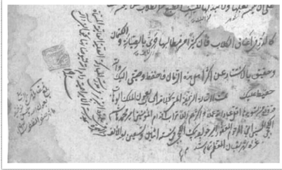
تصویر ۳. انجامه دستنویس شرح خلاصة الحساب از عبدالله بن شاه منصور قزوینی (کتابخانه مجلس شورای اسلامی، شماره بازیابی ۱۸۰۴۹/۲)

«تمت الرسالة الشريفة المسمی بخلاصة الحساب بعون الملك الوهاب. قد وقع من تسويدها اقل عبادالله عملاً و اكثرهم زللاً تراب اقدام المؤمنین امیر محمدهاشم الكججی الحسینی ابن المرحوم المغفور امیر خواجه بیك الكججی فی سنة اثنین و تسعین بعد الألف [دنباله در در هامش انجامه:] من الهجرة، فی بلدة التبریز فی مدرسة المباركة العلیة العالیة المسماة بمدرسة الإبراهیمة - دام الله فیوضاتها بحق النبی و آله. سنة ۱۰۹۲. غره شهر شعبان المعظم تمام شد. م م م. [مهر چارگوش با قلم نستعلیق به نقش] عبده میرهاشم.