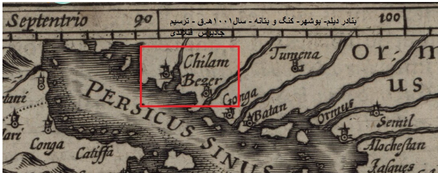
Arabia [F-1-1] (1/1)

همچنین نقشه «جادیوس هندیوس» ۱ فنلاندی (۱۵۶۳-۱۶۱۲م) که در حدود ۱۵۹۳م/۱۰۰۱ق. در آمستردام تهیه و چاپ اولیه آن در سال ۱۵۹۸م/۱۰۰۶ق. منتشر شده است. این نقشه دارای مکان نمایی بهتری است و بعد از هرموز، کنگ و بوشهر، ۲ در محل بندر دیلم واژه لاتین «chilam» را نوشته است. ۳ (در هر چهار نقشه مورد اشاره، به صراحت از بندر دیلم نام برده نشده است، ولی با ضبط نام چیلم/دیلم؛ از وجود بندری نوظهور، هر چند کوچک در ساحل خلیج فارس سر نخ می‌دهد).