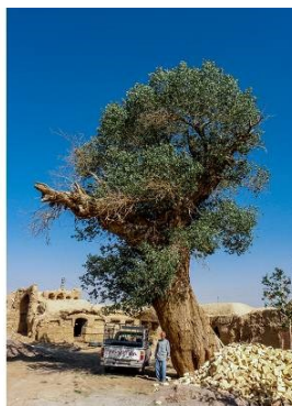
تصویر شماره ۶. درخت صنوبر روستای خرداد تصویر شماره ۷. تصویر سرو آذر (سرو صحافیها)