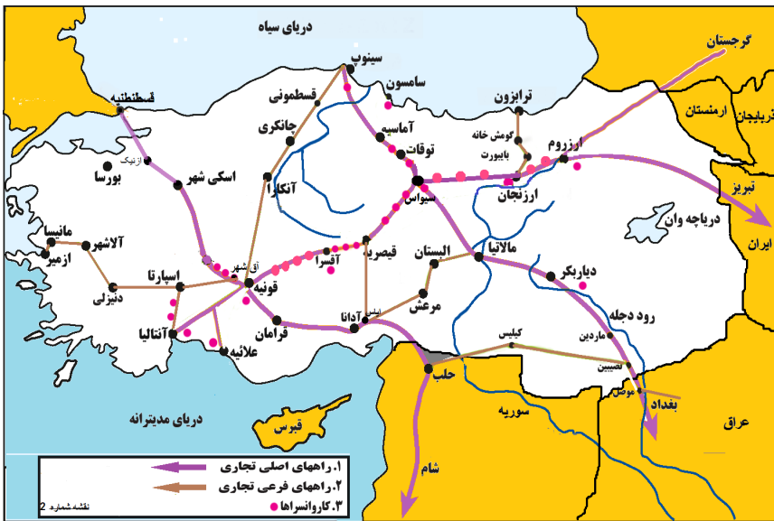
نقشه شده توسط نگارنده راه‌های تجاری و کاروانسراه‌های آناتولی در عصر سلاطین سلجوقی روم

دو شاخه تقسیم می‌شد. اولی از طریق ارزنجان و ارزروم به تبریز می‌رسید و دومی نیز در جهت شمال غربی، از طریق توقات و آماسیه به سامسون می‌رسید. البته راه‌های فرعی و منطقه‌ای دیگری نیز وجود داشت که در درجهٔ دوم اهمیت تجاری قرار داشتند؛ مانند مسیر راه آنتالیا، اسپارتا، دنیزلی، آلاشهر، مانیس و ازمیر و مسیر دنیزلی به آق‌شهر و یا مسیر ترابزون، گومش‌خانه و بایبورت به ارزنجان (Tabakoglu, 1994:116) (نقشه شماره ۲).